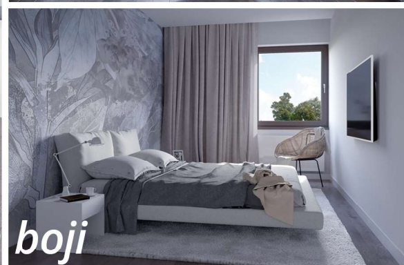
Penthouse stanovi se grade u orah boji